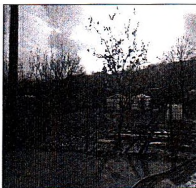
Изгледи към имота