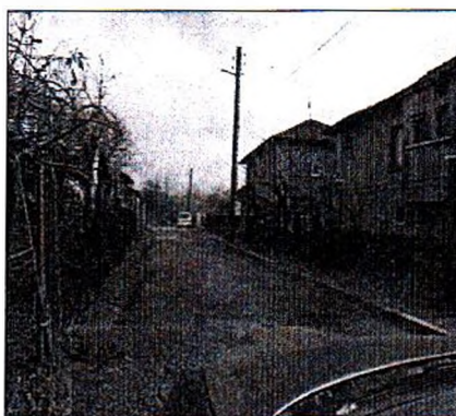
Довезждащ път до имота

Оценяваният застроен терен представлява УПИ XXXVII в кв. 25-б по ПУП на село Царевец, община Свищов. Довезждащият път до имота е асфалтиран, като настилката е значително износена. Има тротоар. Имотът е водоснабден, канализиран и електрифициран. Районът е умерено престижен. Търсенето на подобни имоти е задоволително.